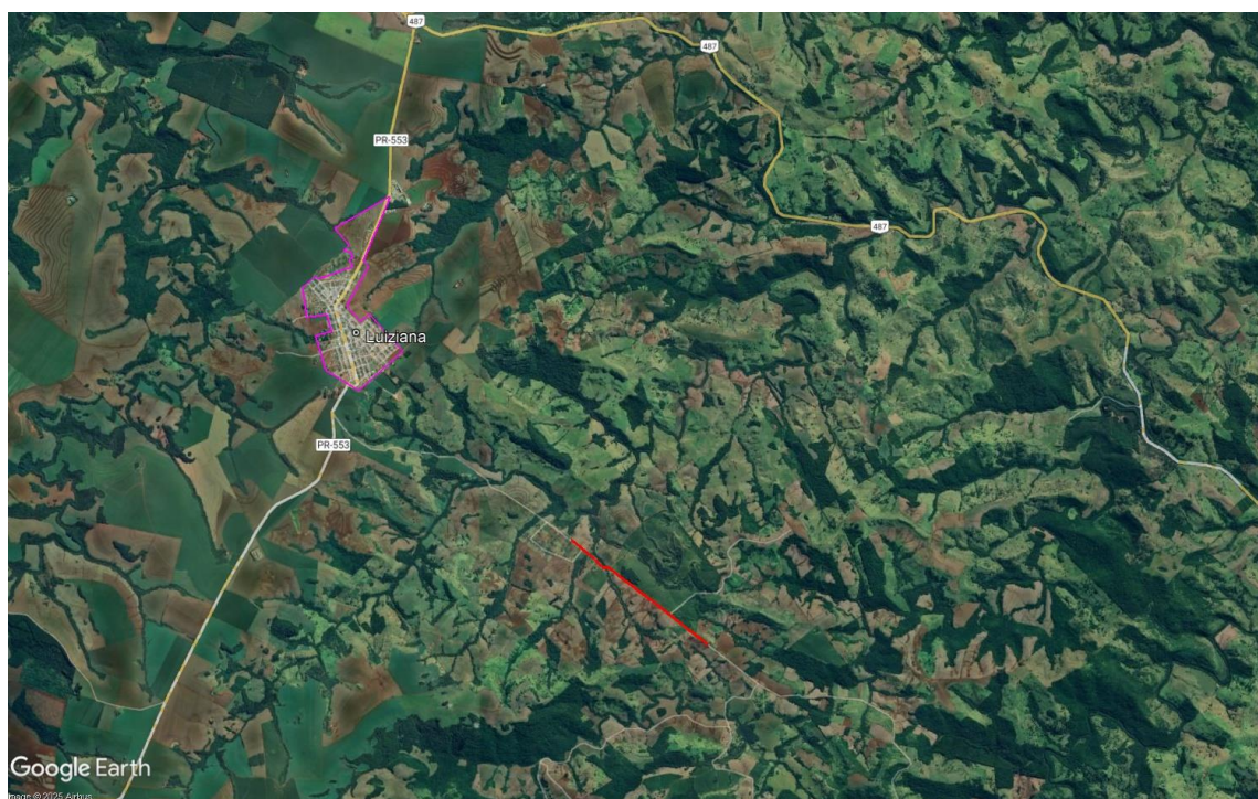
Figura 2 – Mapa de localização