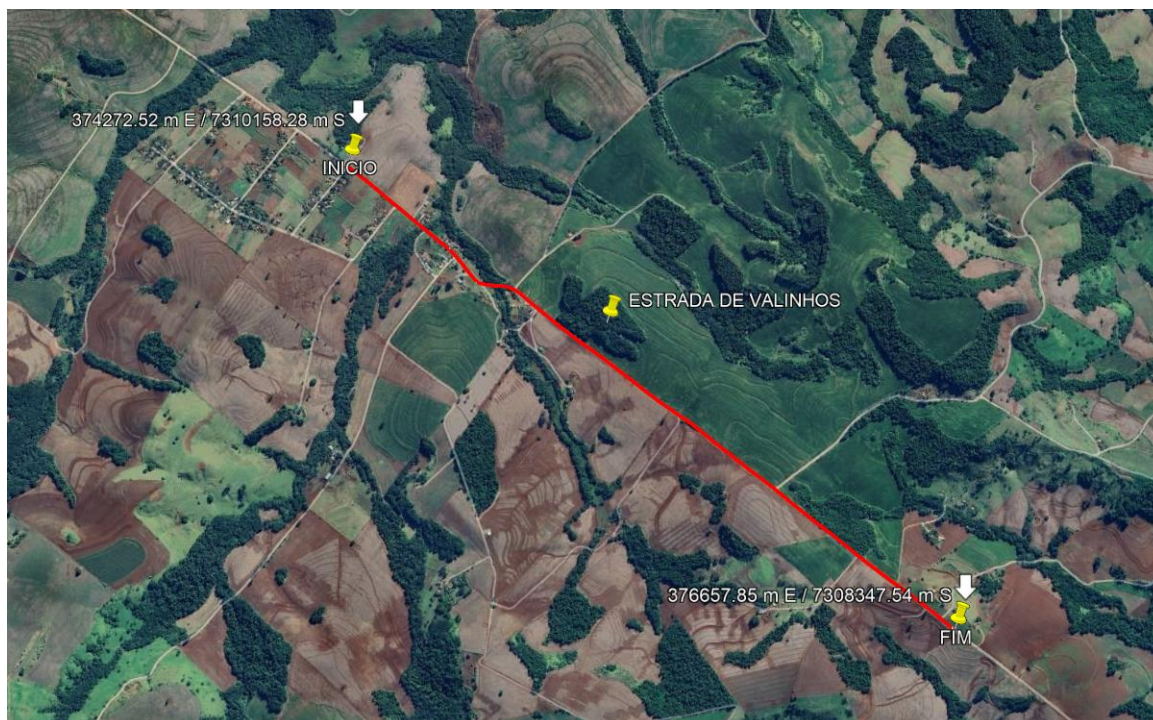
Figura 1 – Mapa de localização.

CNPJ: 80.888.688/0001-27 www.luiziana.pr.gov.br E-MAIL: planejamento@luiziana.pr.gov.br FONE: (44) 3571-1854 - (44) 9 2002-3959 Av. Independência, nº1100 - Jd. Alvorada - Luiziana/PR